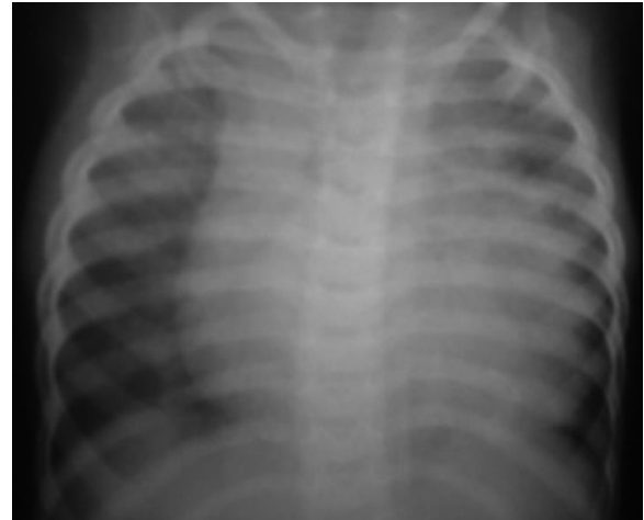
Figura 1. Cardiomegalia en las imágenes de radiografía de tórax del paciente.

intolerancia al decúbito; decaído y quejumbroso; edemas generalizados blandos. Al examen físico se constata: polipnea ligera; tiraje subcostal; murmullo vesicular disminuido en ambas bases pulmonares; estertores crepitantes bibasales y frecuencia cardíaca de 120 latidos por minuto; hepatomegalia de \pm 4 cm, que impresionaba congestiva, con reflujo hepatoyugular. En radiografía de tórax se constató cardiomegalia (Figura 1).