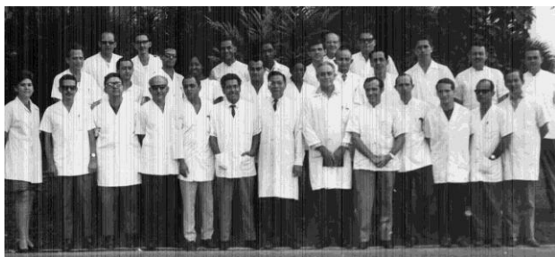
Figura 2. Médicos del Hospital Neurológico.

La labor del Hospital Neurológico se organiza con un arduo trabajo asistencial, al final de cada día de trabajo, en ocasiones de noche, cursos de clases teóricas, de diversos aspectos de las ciencias neurológicas, para la formación de los residentes y se organizan sesiones acerca de temas clínicos, patológicos y radiológicos con una gran participación de galenos de diversas instituciones lo que proporcionan un gran realce científico en las ciencias neurológicas a la institución ( Figura 2 ). En el transcurso de ese año se incorpora al colectivo de trabajo un neurocirujano que marcaría pauta en el desarrollo de la NC en el país por sus enseñanzas y experiencias, el querido y bien recordado Profesor Liudomir Karaguiosov, procedente de Bulgaria.