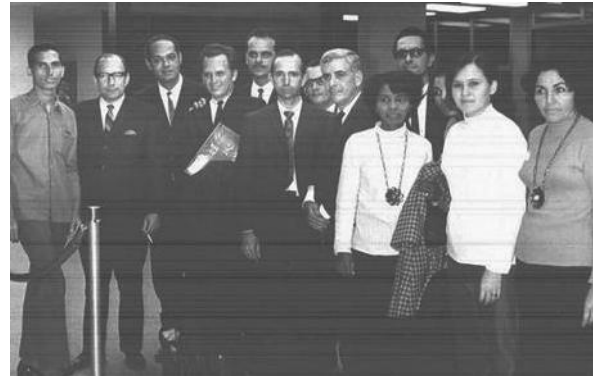
Figura 5. Médicos internacionalistas.

Una de las labores más importantes que se ha desarrollado en la NC ha sido el denominado Internacionalismo, nuestros especialistas han prestado asistencia médica en más de 20 países del tercer mundo, incluso en numerosos desastres naturales, de manera desinteresada y cada uno de nosotros nos sentimos orgullosos de haber tenido la oportunidad de contribuir en la salud de los que tienen menos. En un momento determinado recibimos ayuda solidaria de neurocirujanos de otros países procedentes de Latinoamérica, la URSS, Bulgaria y por eso no hemos hecho más que pagar nuestra deuda de gratitud con la salud de los pueblos, que es lo más importante, nuestros especialistas han estado y están presentes en: Argelia, Angola, Tanzania, Vietnam, Ghana, Yemen, Chile, Nicaragua, Libia, Etiopía, Guinea, Siria, URSS, entre otros. En la foto una parte del Grupo que participó en las labores por el terremoto en Chile ( Figura 5 ).