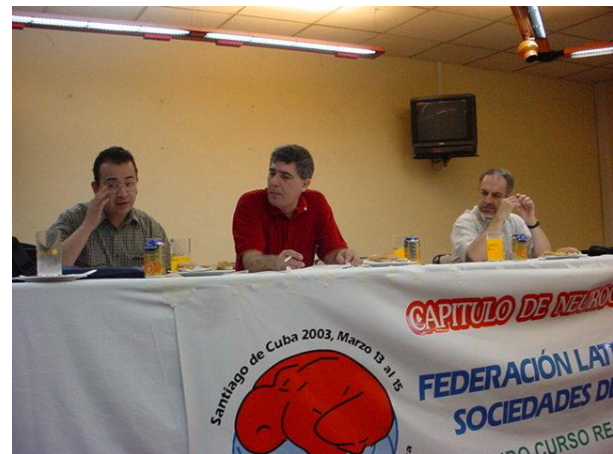
Figura 7. Participación en los CLAN (Santiago de Cuba, 13-15 de Marzo del 2003).

Hemos tenido participación en numerosos eventos Internacionales a nivel mundial, continental y regional; aunque debía haber sido más en el contexto Latinoamericano; por esto uno de los propósitos en los próximos años es incrementar nuestra presencia y contribuir con nuestras modestas posibilidades al desarrollo de la NC en nuestros países. Ya en los últimos años hemos logrado un acercamiento con participación en los CLAN (Figura 7).