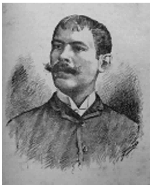
Figura 2. Dr. Manuel Moreno de La Torre (1861–1891).

“Contribución al Estudio de la Fiebre Amarilla” (1890), y el reporte que es motivo de nuestra investigación: “Absceso Cerebral, trepanación, curación, recidiva, muerte” (1891) que apareció en el volumen 17 # 1, 1891, de la revista “Crónica Médico– Quirúrgica de La Habana” (27).