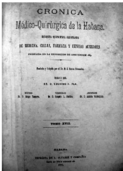
Figura 1. Carátula de la Revista “Crónica Médico-Quirúrgica de La Habana” (1875–1940).

desarrollo de las Ciencias Médicas en la Mayor de las Antillas, pues a sólo 5 años de haberse realizado en el mundo las primeras intervenciones neuroquirúrgicas seriadas, se reporta desde el punto de vista científico y no anecdótico, un caso de cirugía cerebral en Cuba.