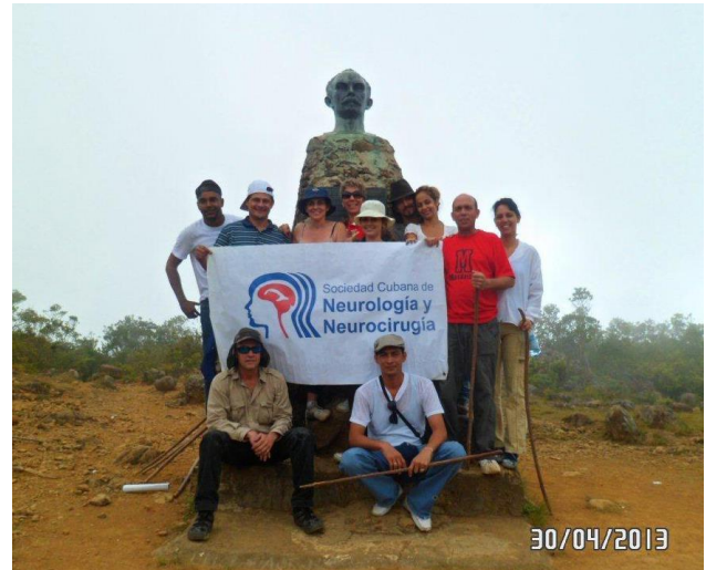
Figura 3. Homenaje de la SCNN al Maestro en el 160 aniversario de su natalicio.